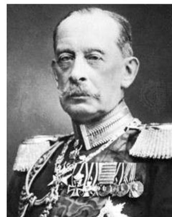
Алфред фон Шлифен (1833-1913г.) - германски фелдмаршал и началник-щаб. Съставя прочутия "План Шлифен", предвиждащ война срещу Франция и Русия.

Разбира се, военното превъзходство само по себе си не е достатъчно, за да бъде осигурен крайния успех в една кампания. Не по-малко решаваща е дипломатическата подготовка на една толкова голяма конфронтация. В това