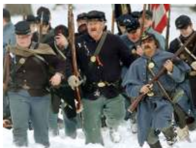
Възстановките на сцени от Гражданската война в САЩ (1861-66г.) са изключително популярни и привличат хиляди ентустиасти всяка година за ежегодните преигравания на основните сражения от войната между Севера и Юга.

Целта на всеки един реенактор и на цялата група участници във възстановката е да бъдат пресъздадени личности от миналото; хора, които напълно достоверно биха могли да съществуват на определено място в определен момент във