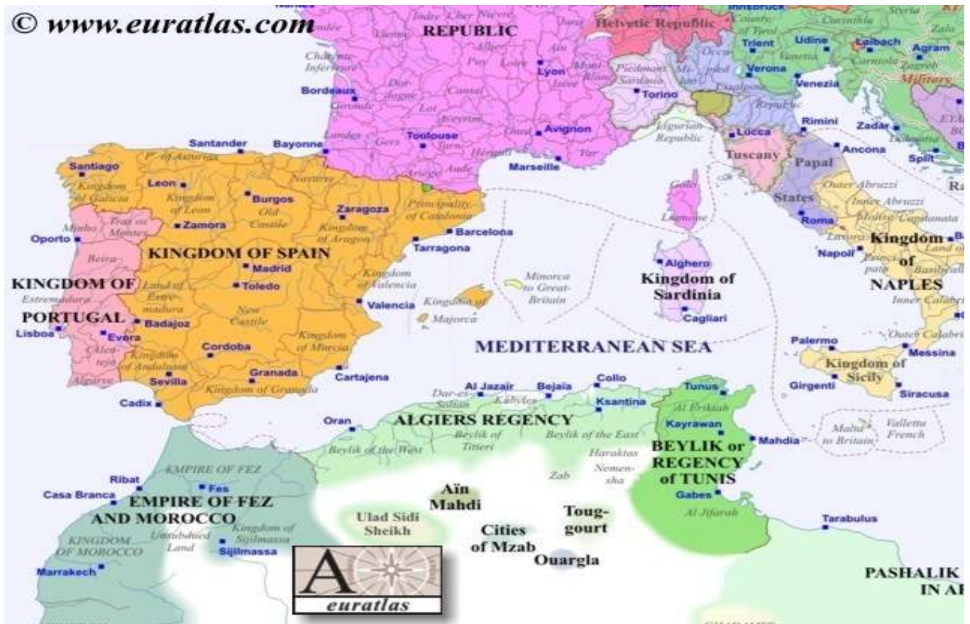
Северното Африканско Крайбрежие около 1800г.

Берберският бряг винаги е бил особена част от Средиземноморският свят. Първоначално владение на Картаген и Рим през Античността, тази територия попада в ръцете на вандали, византийци и накрая е завладяна от войските на Умаядите. След разпадането на Умаядския халифат през 750 г., Берберският бряг става последователно владение на няколко местни берберски династии, зависими от Алмохадите и Алморавидите в Андалусия и от Фатимидите и Аюбидите в Египет. След възцъряването на мамелюците в Египет, техните владетели подчиняват пряко Триполитания, а Тунис остава васална територия. Що се отнася до крайбрежието на Алжир, то остава свободна територия, като всеки отделен град, се управлява от собствен, местен владетел. Основното препитание на местните моряци станало пиратството.