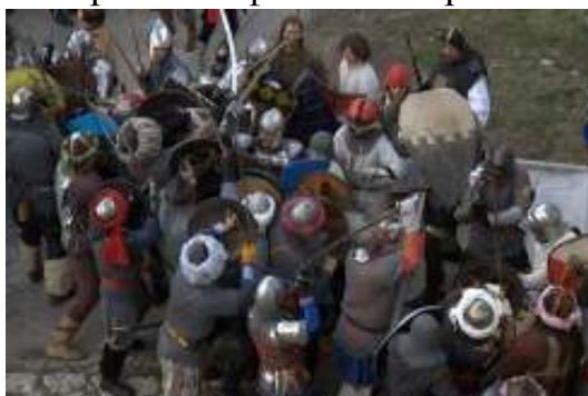
През последните няколко години, в България също започнаха да се организират исторически възстановки, като най-популярни за момента са битките между османци и кръстоносци.

- Третата група обединява манаците и екстремистите на тема историческа достоверност. Реенакторите-екстремисти често се занимават със задълбочени научни изследвания на различни аспекти на миналото, опитват се да живеят като предците си от епохата, която възпроизвеждат, сами изработват въоръжението и дрехите си. Нерядко тренират историческа фехтовка и различни бойни изкуства. Някои от тях, бидейки учени, учители или университетски преподаватели, четат лекции по време на възстановките. Някои от най-сериозните общества, практикуващи реенактмент, създават свои собствени научно-изследователски групи, за да задълбочат своите познания за историческия период, който пресъздават. Представителите на тази група обвиняват колегите си от другите две групи в твърде голямо отдалечаване от историческата действителност и в изкривяване на образа на възстановяваната епоха, което те считат за твърде неуместно. Манията им към перфекционизъм понякога кара тези хора да се отделят в отделни лагери в рамките на големия лагер, за да са по-далеч от аматьорите, и избягват да се смесват с тях. Зрителите на събитието получават по-голямо удовлетворение при вида на високото ниво