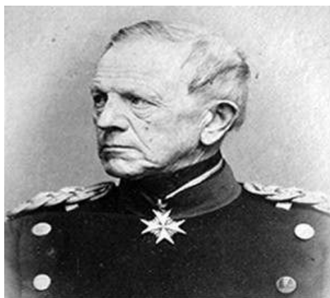
Хелмут фон Молтке (1800-1891г.) Пруски фелдмаршал и началник-щаб в продължение на 30 години.

Междувременно събитията следват своя естествен ход. През лятото на 1873г. в европейските дипломатически кабинети се разпространява слуха за герmano-руска военна конвенция. С пълна пара се гради и Съюза на тримата императори- тези на Германия, Русия и Австро-Унгария. В този момент френската преса започва истинска медийна война, с която иска да докаже, че Германия се готви да нападне Франция под предлог, че последната забавя плащанията по репарациите (абсурден аргумент).