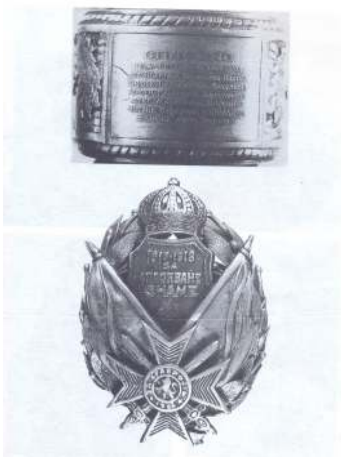
6. Знак за спасяване на знаме и възпоменателна гривна с имената на спасителите на знамето.