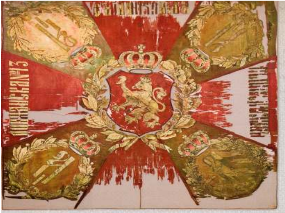
1. Военно знаме (Батенбергово) обр. 1881 г.