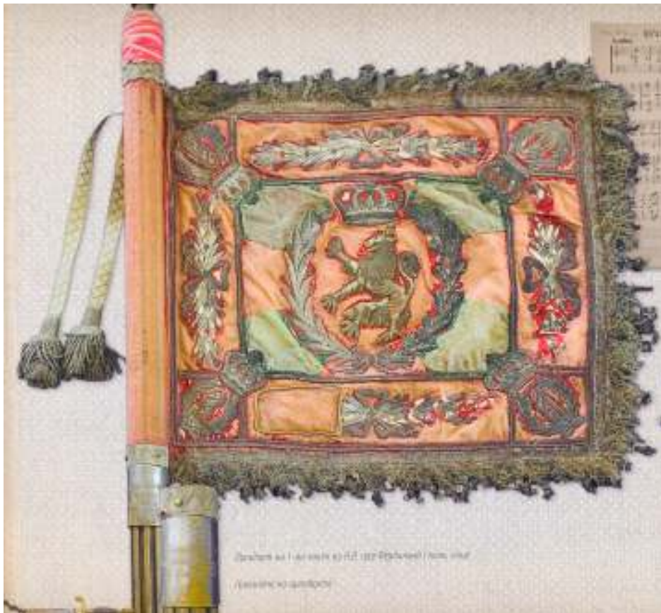
2. Кавалерийски щандарт обр.1881 г.