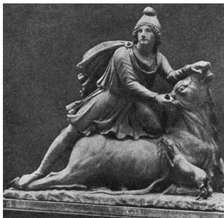
Богът-Войн Митра – едно от най-популярните божества в Късната Античност. Поклонниците му се срещат от Индия до Британия. Много от мистерииите му се превръщат в основа за най-популярните християнски празници.

Култът към войната е едно от най-древните и устойчиви религиозни течения. Боговете на войната, техните служители и ритуалите, свързани с култовите им обреди са неизменна част от всяко общество. Ще дам само няколко примера. Древно персийският бог-войн Митра се превръща в едно от най-почитаните божества в древността. Култът му се разпространява от Хиндокуш до Британия и се превръща в един от фундаментите на новата световна религия – Християнството. В самото християнство, макар и пацифистично по своята идея, светците-войни – Георги, Михаил и Гавраил са едни от най-почитаните фигури, отстъпващи само на Светата Троица и Дева Мария. Не на последно място, в Исляма, идеята за свещена война – джихад, насочена както към самия индивид, така и срещу неверниците има централно място в религиозната доктрина.