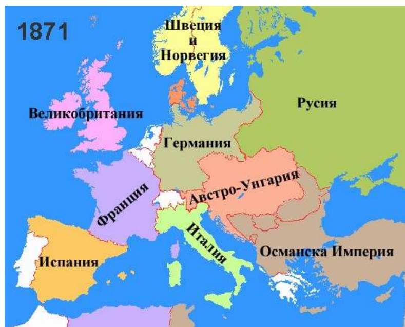
Европа след Френско-Пруската война (1870-71г.)

На 2 септември 1870г. френската армия е буквално унищожена при Седан. Месец по-късно армията на фелдмаршал Мак Махон се предава при Мец. Новата пруска желязна военна машина, командвана от тактическия гений на Молтке и направлявана от дипломатическия гений на Бисмарк за месец и половина унищожават мита за френската военна мощ. Последвалата капитулация на Париж е експлозия в дипломатическите кабинети в Европа. Родила се е нова империя.