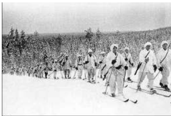
Поради изключително тежките зимни условия, и липсата на разчиствени пътища за придвижване и отстъпление, скиите се оказали едно от най-бързите и евтини средства за придвижване по време на Съветско - Финската война

Войната започва с бомбардировка на Халзинки на 30.11.1939 г., загиват 200 цивилни. Съветското настъпление стартира по цялата дължина на границата превзето е северното пристанище Петсамо. Балтийският флот удря по фортификациите на Ханко, но е отблъснат от бреговата артилерия – крайцерът Киров и един ясминец понасят щети. На 1-ви декември 8-ма армия северно от Ладожкото езеро предприема атака на фронт от 80км. Финландците са създали буферна зона директно срещу тях с дълбочина 45км., където всички села са били опожарени и минирани, като се предвижда да се даде възможност на врага